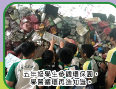
五年級學生參觀環保園，學習循環再造知識。