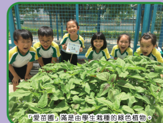
「愛苗圃」滿是由學生栽種的綠色植物。