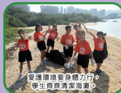
愛護環境要身體力行，學生齊齊清潔海灘。

為了營造可持續和舒適愉快的優良學習環境，校內設有不少環保設施，例如安裝在天台的太陽能發電板、讓學生體驗種植和生態的「愛苗圃」及「魚菜共生」區。校方亦安排很多綠色活動讓學生參與，譬如常識科有「惜水學堂」攤位活動，傳授學生慳水知識；「明日之後，環保之旅」專題研習要求學生用環保物料製作模型，將環保引入生活，真的十分多姿多彩！