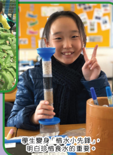
學生變身「惜水小先鋒」，明白珍惜食水的重要。