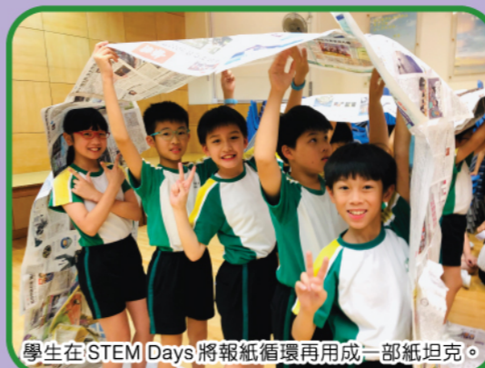
學生在STEM Days將報紙循環再用成一部紙坦克。