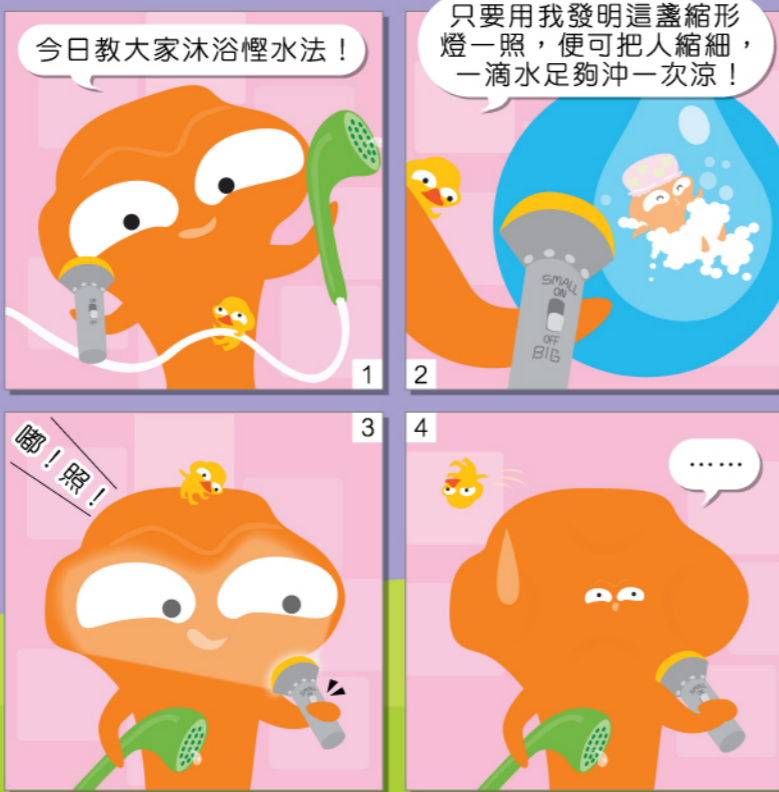
今日教大家沐浴慳水法！