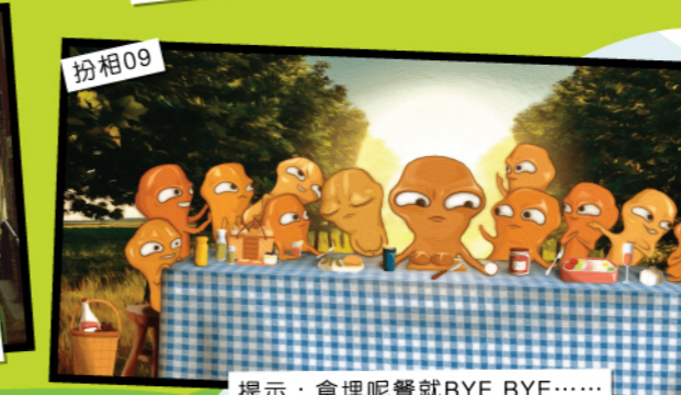
扮相09 提示：食埋呢餐就BYE BYE……