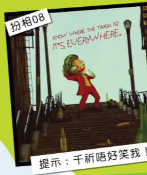
扮相08 提示：千祈唔好笑我！