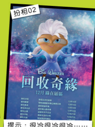
扮相02 提示：很冷很冷很冷……