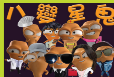
阿鬼扮過的人物多不勝數。

為了支持和宣傳環保，大唯鬼可以去到幾盡？你對他的認識有多少？小讀者不妨來玩個遊戲，看看以下阿鬼在這幾年間出現過的造型，猜猜他到底在扮演甚麼身份角色？