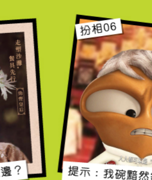
扮相06 提示：我碗雖然銷魂飯呢？