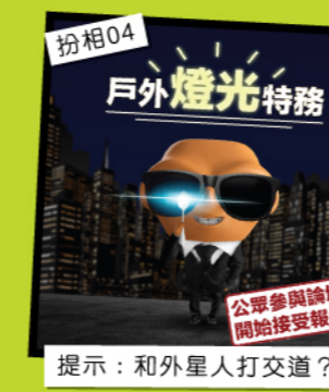
扮相04 提示：和外星人打交道？