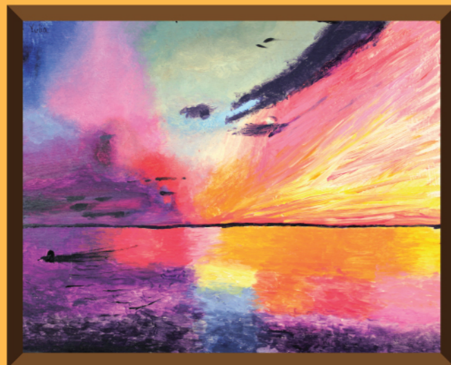
Sunset By Yulia

Evening comes, blazing with colour. Paints the sky pink and gold, not a shade duller. Then comes blobs of pigment, here and there, Splattered among the canvas, everywhere. Admire this scene as it lasts, You will find that these colours fade out too fast. As the sky merges into black and grey, Remember that the sun will rise again the next day.