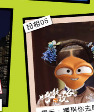
扮相05 提示：纓珞你去咗邊？