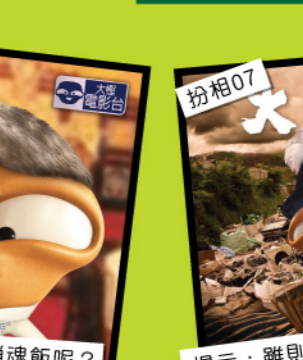
扮相07 提示：雖則我唔係玉樹臨風……