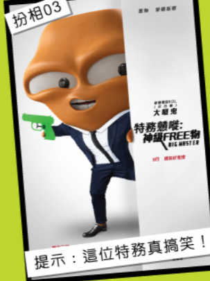
扮相03 提示：這位特務真搞笑！