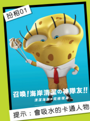
扮相01 召喚！海岸清潔的神隊友!! 提示：會吸水的卡通人物