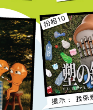
扮相10 提示：我係煉金唔係煉膠的嗚……